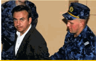
Pr Yuri Bandazhevsky